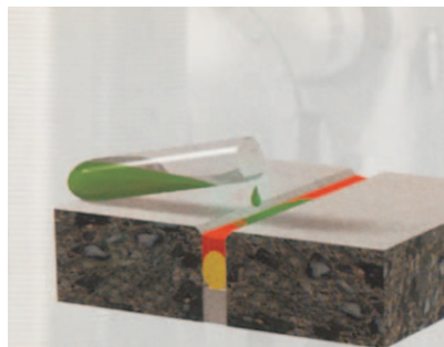
Magas vegyi terhelésű ipari padlószervezetek hézagtömítése