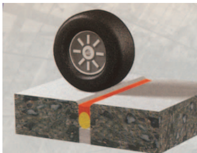
Nagy mechanikai terhelésű ipari padlószervezetek hézagtömítése